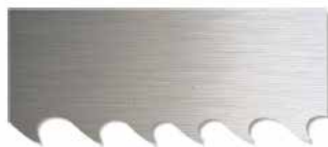
Serra de Fita em Metal Duro