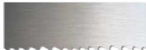
Serra de Fita Bimetálica