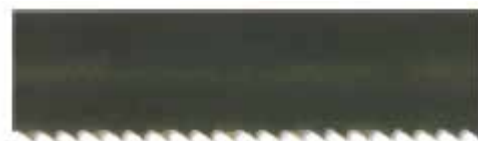
Serra de Fita em Aço Carbono