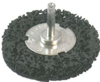
CARBORETO DE SILÍCIO