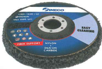
CARBORETO DE SILÍCIO